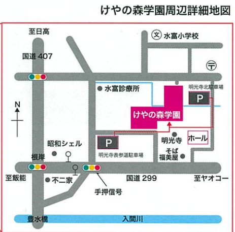
けやの森学園周辺詳細地図